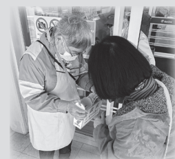
サンリブのおがた店